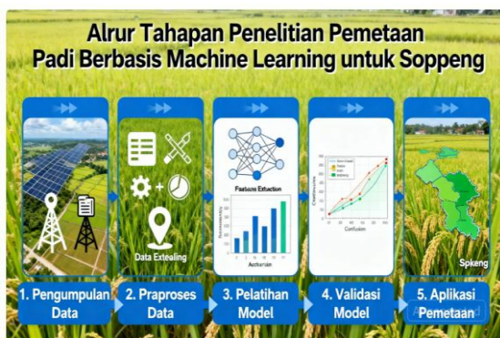
Gambar 1. Tahapan Penelitian

Setiap tahapan dirancang mengacu pada praktik terbaik pemetaan berbasis citra Sentinel-2 dan machine learning di konteks Indonesia, serta integrasi dengan data resmi untuk perencanaan ketahanan pangan daerah (Soppeng, 2023). Adapun tahapan penelitian yang dilakukan selama melaksanakan penelitian ini adalah sebagai berikut:.